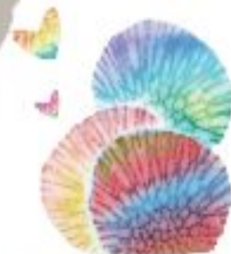
サンゴアート作品